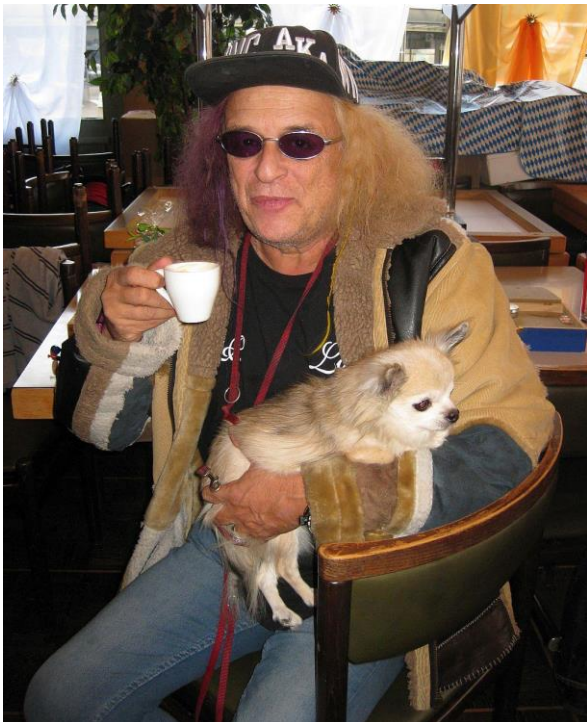
Zuschauer mit Hund